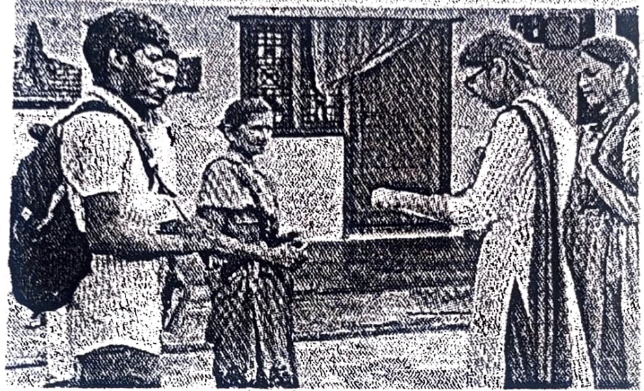
మహిళ నుంచి వివరాలు సేకరిస్తున్న విద్యార్థులు