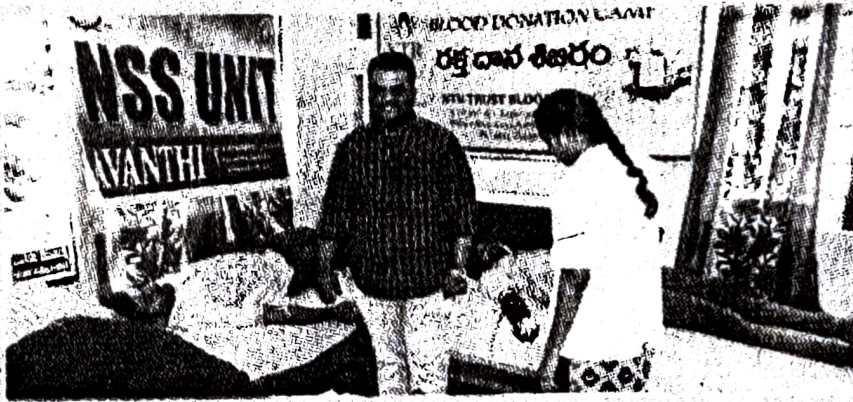
రక్తదాన శిబిరం నిర్వహిస్తున్న అవంతి విద్యార్థులు